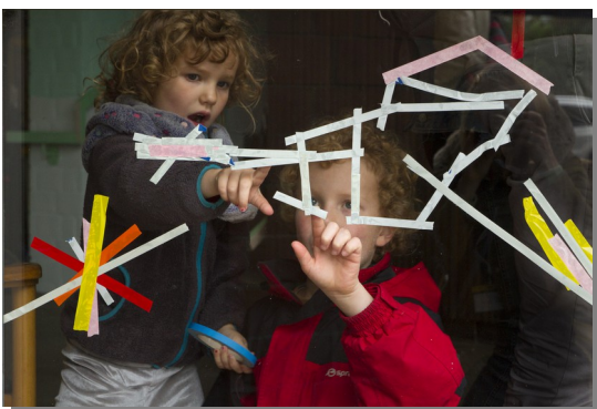
© KinderKulturMonat, Foto: Dora Csala – Urban Nation, 2017.